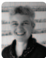
Artista Têxtil e Designer